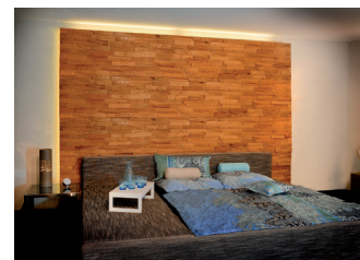
Holz sieht nicht nur gut aus, sondern gibt von Natur aus Wärme in den Raum ab. Gerade im Schlafzimmer sorgt es deshalb für ein gutes Klima. 015 03