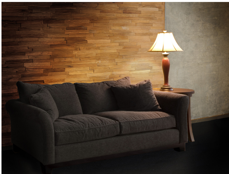
Ein Eyecatcher: Die Wohnzimmerwand mit Holzoberfläche lässt den Raum gemütlich wirken. Wer eintritt, fühlt sich sofort wohl. 015 02

Diese Textversion sowie zwei weitere Versionen können Sie im Internet herunterladen.