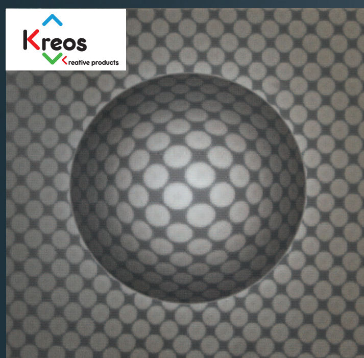
KREOS-3D-Graphic-Panel „Paul's Ball“ (KREOS-3D-GP02)

Die 3D-Graphic-Sheets sind in über 20 Designs in den Massen 90 cm x 68 cm erhältlich. Diese Designs können auf jeden Träger gebracht werden und sind an allen Seiten rapportfähig. Für Individualisten gibt es sogar 2 Rohdesigns (KREOS 3D-Roll), welche mit jedem Standarddrucker (Water oder Solvent) individuell und selbst bedruckt werden können. Die KREOS 3D-Welt kennt keine Grenzen!